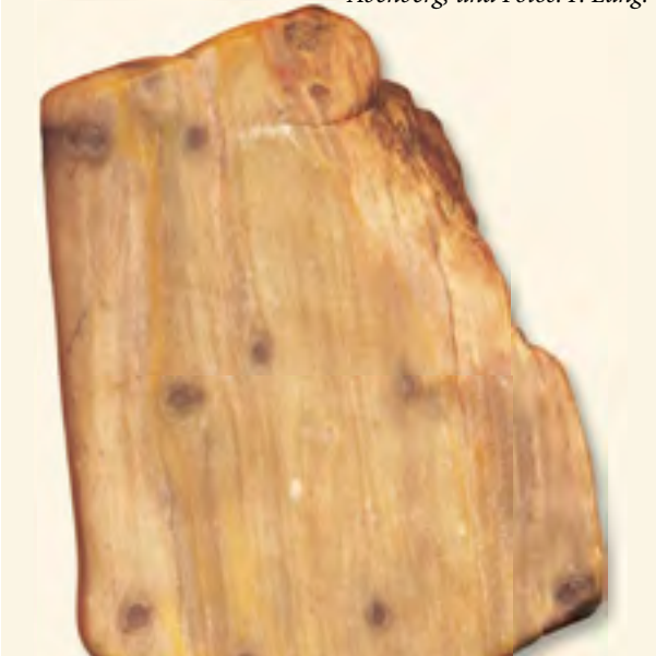
Unten: Keuperholz mit horizontalen Astansatzreihen, 5,8 x 4,1 cm, Sandgrube Gauchs Dorf. Sammlung, mit Ausnahme der Baumstämme auf der Burg Abenberg, und Fotos: F. Lang.