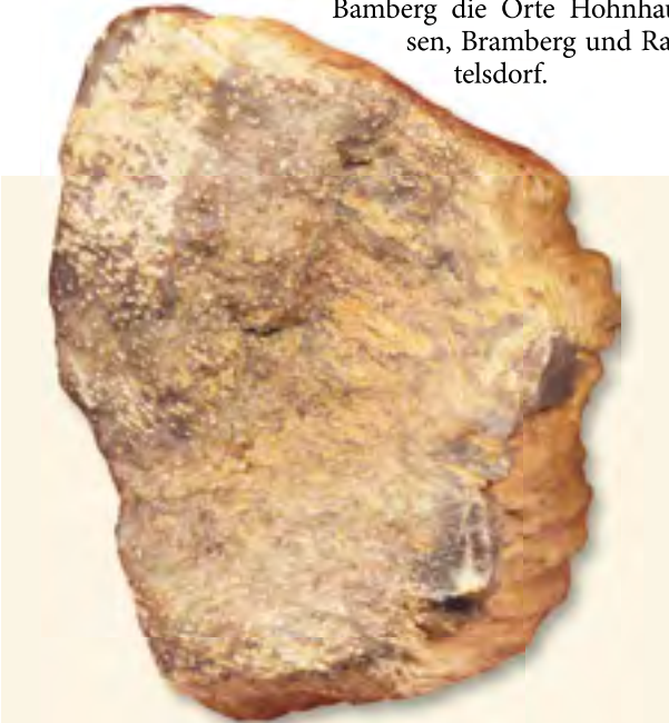
Dunkles Holz mit im Querschnitt leicht erkennbaren Tracheiden, vermutlich Perm, ca. 6 cm, Büchenbach.

ein paar wenige altbekannte fränkische Fundgebiete der weiteren Umgebung seien genannt der Höhenrücken „Osing“ zwischen Krautostheim und Rüdlsbronn nahe Neustadt/Aisch, Erlangen-Büchenbach sowie östlich von Bamberg die Orte Hohnhausen, Bramberg und Rattelsdorf.