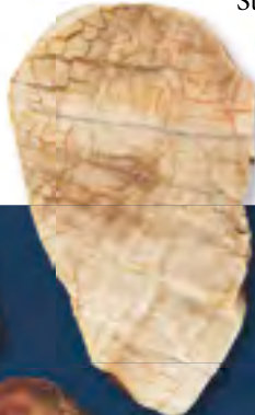
Links: Keuperholz mit poliertem Querschnitt, Breite 5,6 cm, Sandgrube Gauchsdorf.