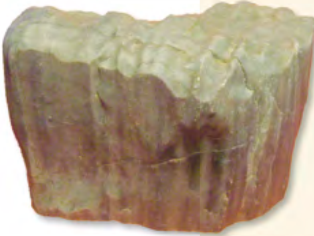
Links: Keuperholz mit Wasserschliff, Breite 14,4 cm, aufgelassene Sandgrube westl. Roth.