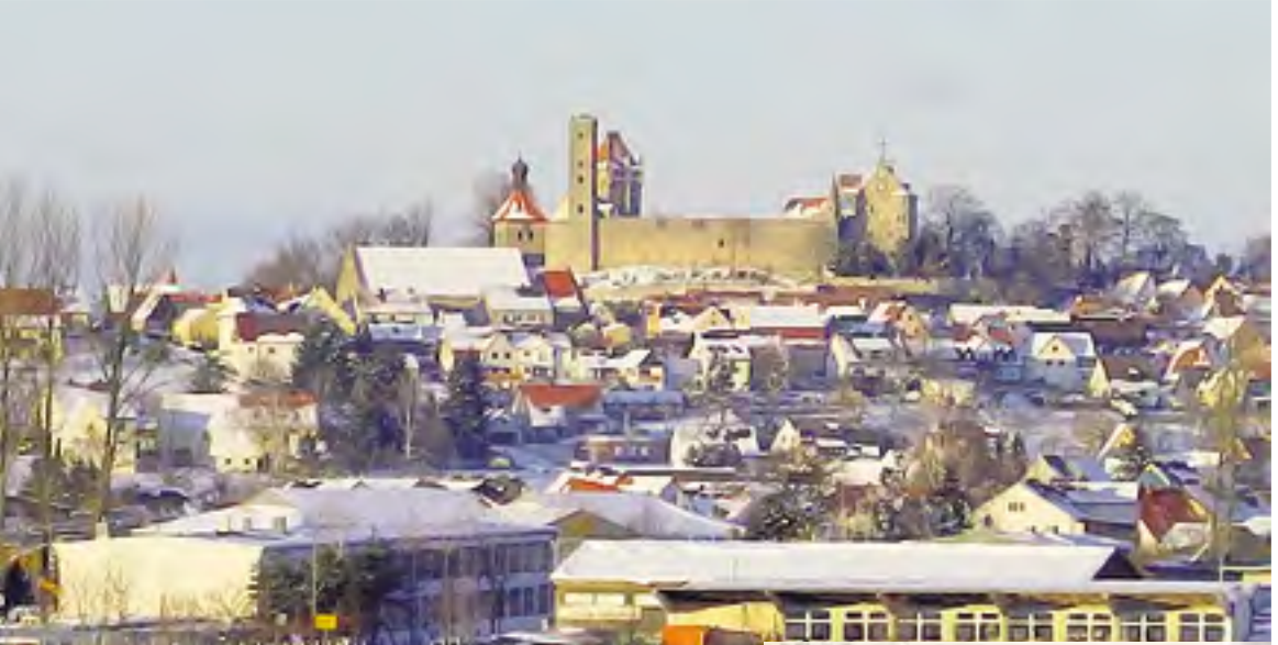
Die Burg Abenberg.