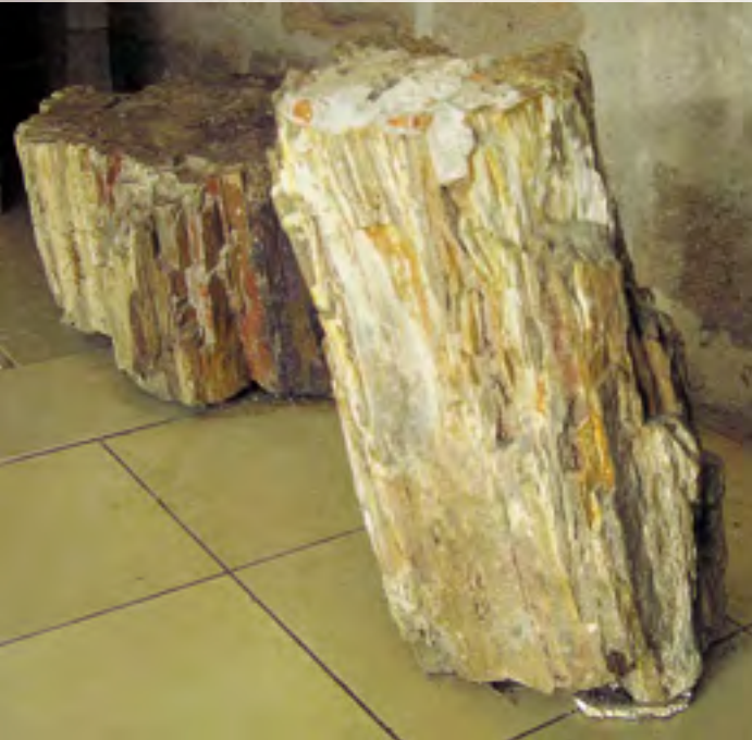
Kieselhölzer auf der Burg Abenberg, vorderes Holz Höhe ca. 1 m.

Hauptsächlich sind Funde aus den Plattenkalken von Eichstätt und Solnhofen zu sehen, wie Fische, Insekten, Ammoniten und Schlangensterne, aber auch Trilobiten, Seeigel, Schnecken sowie Pflanzen anderer Schichten und Regionen. Ein Besuch lohnt sich schon allein wegen der schönen Burganlage, in der seit neuestem auch ein Klöppelmuseum untergebracht ist. Und wer den „Lug ins Land“ besteigt, genießt einen herrlichen Ausblick über die Keuperlandschaft der Umgebung.