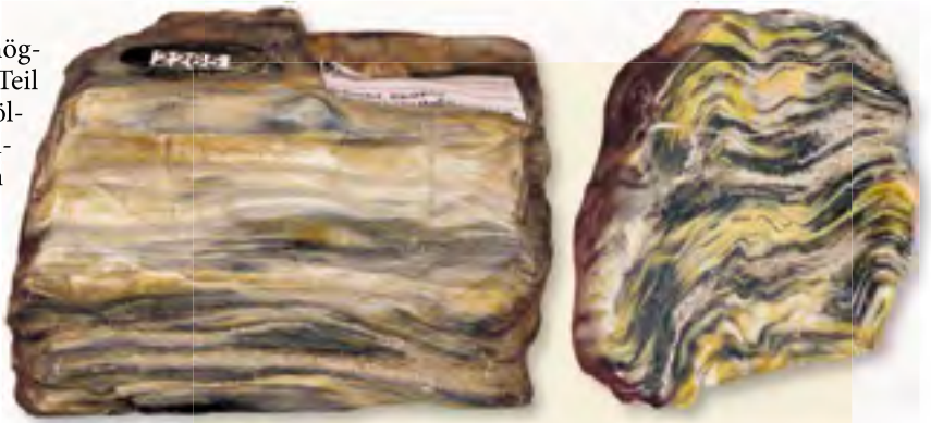
Oben; Dunkles Holz, poliert, Perm, Obersteinbach. Länge des linken Stücks 5,8 cm.

sehr schwierig bis unmöglich. Der überwiegende Teil der fränkischen Kieselhölzer gehört zu den Nadelbäumen. Selten werden aber auch leicht erkennbare Stücke mit wahlloser Verteilung der Leitbündel im Querschnitt geborgen, die große Ähnlichkeit mit Palmenhölzern aufweisen.