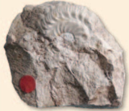
Abb. 8: Granulochetoceras ornatum (Berckheimer & Hölder) mit deutlicher Kielwellung, Obere Felsenkalk-Formation, Ober-Kimmeridgium, Beckeri-Zone, Setatum-Subzone, Tuttlingen. Breite des Fragments 19 mm. SMNS 19521.

tenreichtum rührt daher, dass sich dort neben den einheimischen, submediterranen Formen auch Zuwanderer aus anderen Faunenprovinzen getummelt haben. Nachdem Süddeutschland im Verlauf des Oberjura mehr und mehr an den mediterranen Tethys-Ozean im Süden angeschlossen wurde und die Verbindungen nach Norden abgerissen waren, stammen die allermeisten Zuwanderer aus der Tethys. Wir finden dieselben Formen heute beispielsweise in den Süd- und Ostalpen, den Apenninen, in Südspanien oder in Sizilien. Typisch mediterrane Gattungen, die gelegentlich nach Süddeutschland einwanderten, sind beispielsweise Idoceras , Nebroditis , Presimoceras , Ceratosphinctes , Epaspidoceras , Pseudhimalayites , Hybonoticeras , Amoebopeltoceras , Oxydiscites und eben auch Granulochetoceras .