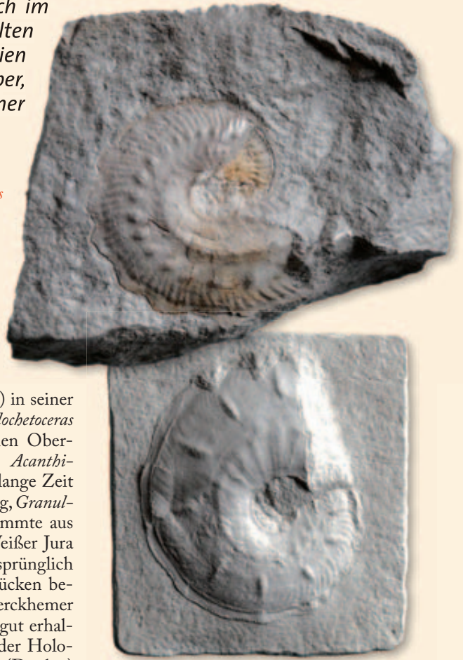
Abb. 2: Granulochetoceras cristatum (Dieterich), Gipsabguss. Formation der Wohlgeschichteten Kalke, Unter-Kimmeridgium, Planula-Zone, Sauserberunnen bei Laufen a. d. Eyach, Durchmesser 47 mm. SMNS Nr. 67763, Sammlung: A. Hagenlocher.

Später tauchten dann auch in anderen stratigraphischen Abschnitten des süddeutschen Oberjuras Angehörige der Gattung Granulochetoceras auf. So beschrieb Höroldt (1964) in seiner Dissertation die neue Art Granulochetoceras undulatum (Abb. 7) aus dem frühen Ober-Kimmeridgium (vermutlich der Acanthicum - oder Eudoxus -Zone). Die für lange Zeit älteste bekannte Form dieser Gattung, Granulochetoceras cristatum (Dieterich), stammte aus den Wohlgeschichteten Kalken (Weißer Jura Beta) des Schwäbischen Juras. Ursprünglich in nur wenigen unvollständigen Stücken bekannt (Dieterich 1940), bildeten Berckhemer & Hölder (1959) ein weiteres sehr gut erhaltenes Exemplar davon ab, das wie der Holotypus von Granulochetoceras uracense (Dietlen) aus der Umgebung von Bad Urach stammte. Mittlerweile sind noch einige weitere Stücke dieser Art aus verschiedenen Regionen der Schwäbischen und Fränkischen Alb gefun-