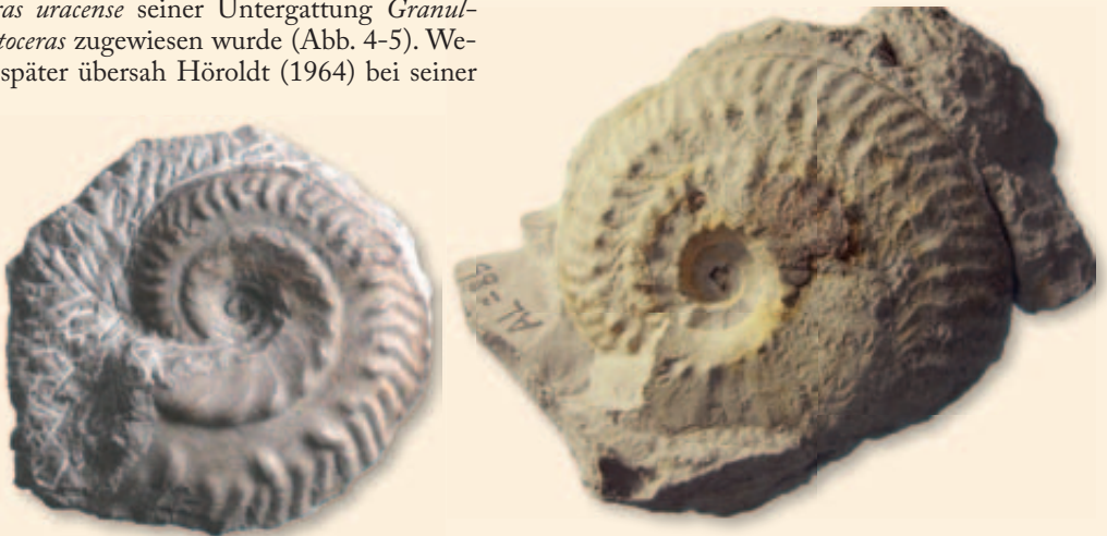
Abb. 4., links Granulochetoceras argonautoides (Mayer). Lacunosamergel-Formation, Unter-Kimmeridgium, höhere Hypselocyclum-Zone, Wasserberg bei Schlät. Durchmesser 32 mm. SMNS 65359. Abb. 5, rechts: Granulochetoceras argonautoides (Mayer). Schwarzbach-Formation, Basis der Hypselocyclum-Zone, Almenbüel, Randen/Kt. Schaffhausen. Durchmesser 55 mm.

Dissertation genau dieses wichtige Merkmal und die daraus resultierende wahre Gattungszugehörigkeit der Art ornatum . Das schon oben erwähnte Granulochetoceras undulatum Höroldt, dessen Holotypus aus dem „Malm Delta“ von Oberböhningen bei Geislingen a. d. Steige stammt, vermittelt zwischen G. argonautoides und G. ornatum . Aus Erkertshofen im Fränkischen Jura kam ein Exemplar (Abb. 6) zum Vorschein, das noch näher an G. argonautoides anschließt und stratigraphisch etwas älter sein dürfte als Höroldts Art. Gerade G. ornatum ist in einem ganz bestimmten Ho-