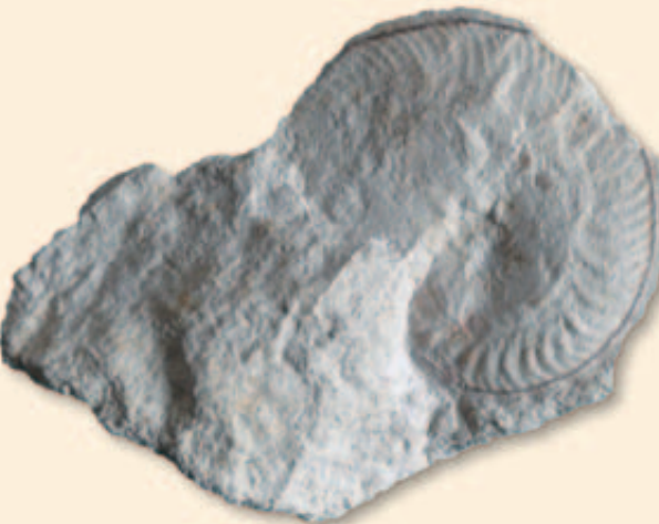
Abb. 7: Granulochetoceras undulatum Höroldt, Untere Felsenkalk-Formation, Ober-Kimmeridgium, Merklingen. Durchmesser 53 mm. SMNS 67764 (leg. R. Kratz).

rizont der schwäbischen Oberen Felsenkalk (Weißer Jura Epsilon) gar nicht einmal so selten, und zwar im ornatum -Horizont. Dieser Horizont ist übrigens nicht nach Granulochetoceras ornatum benannt, sondern nach Hybonoticeras ornatum (Spath), einem anderen mediterranen Einwanderer – womit wir beim Stichwort wären. Die Gattung Granulochetoceras kommt nämlich auffälligerweise nicht durchgehend in allen Oberjura-Schichten vor, sondern nur in solchen mit besonders artenreichen Ammonitenfaunen. Dieser Ar-