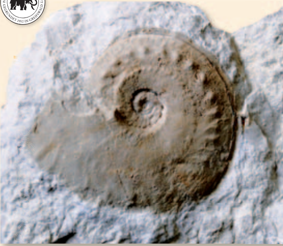
Abb. 6: Granulochetoceras aff. argonautoides (Mayer); dieses Stück vermittelt zwischen G. argonautoides und G. undulatum . Treuchtlingen-Formation, Ober-Kimmeridgium, vermutlich Grenzbereich Divisum-/Acanthicum-Zone, Erkerthofen, Durchmesser 58 mm. Sammlung: J. Wieland.

rizont der schwäbischen Oberen Felsenkalk (Weißer Jura Epsilon) gar nicht einmal so selten, und zwar im ornatum -Horizont. Dieser Horizont ist übrigens nicht nach Granulochetoceras ornatum benannt, sondern nach Hybonoticeras ornatum (Spath), einem anderen mediterranen Einwanderer – womit wir beim Stichwort wären. Die Gattung Granulochetoceras kommt nämlich auffälligerweise nicht durchgehend in allen Oberjura-Schichten vor, sondern nur in solchen mit besonders artenreichen Ammonitenfaunen. Dieser Ar-