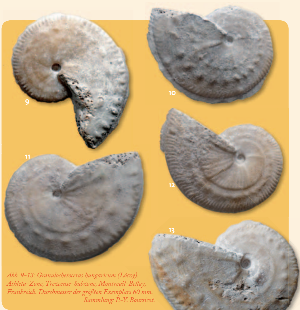
Abb. 9–13: Granulochetoceras hungaricum (Lóczy). Athleta-Zone, Trezeense-Subzone, Montreuil-Bellay, Frankreich. Durchmesser des größten Exemplars 60 mm. Sammlung: P.-Y. Boursicot.

Alb und dem Hochrhein gelegen – weitere Funde von Granulochetoceraten gemacht, darunter auch ein Stück aus der Platynota-Zone, das mit dem Holotypus von G. uracense weitgehend übereinstimmt (Abb. 3A; Moor 2009). Geringfügige Abweichungen hinsichtlich der Stellung der Sekundärrippen dürfen bei diesen variablen Formen nicht überbewertet werden. Demnach vermittelt diese Form nicht nur morphologisch, sondern auch stratigraphisch zwischen den beiden Arten G. cristatum und G. argonautoides . Was jedoch den heute zu verwendenden Artnamen angeht, so entspricht G. uracense zwar nicht argonautoides , stimmt aber so verblüffend mit der Varietät sulculifera Fontannes (in Dumortier & Fontannes 1876) überein, dass an einer Identität mit dieser nicht zu zweifeln ist (Abb. 3B). Granulochetoceras uracense (Dietlen) ist also ein subjektives jüngerer Synonym von Granulochetoceras sul-